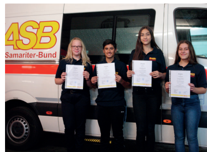
Der ASB gratuliert den neuen Schulsanitatern des Leibniz-Montessori-Gymnasiums (D)

Notfälle, Verletzungen und plötzliche Erkrankungen – das passiert nicht nur in der Freizeit, sondern auch in der Schule. Die Junior-Sanitäter des ASB wissen, was in solchen Situationen zu tun ist.